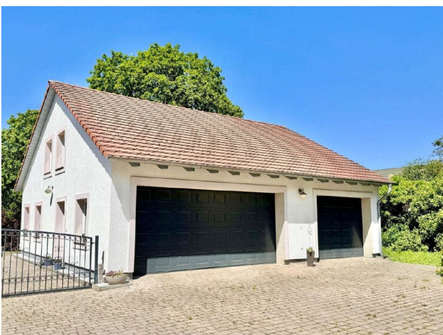
Garagenhaus mit elektrischen Rolltoren