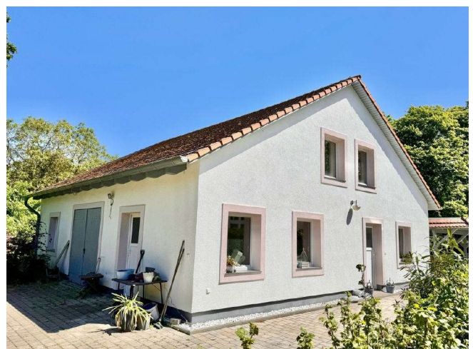
Garagenhaus Rückseite Dachgeschoss mit Atelier