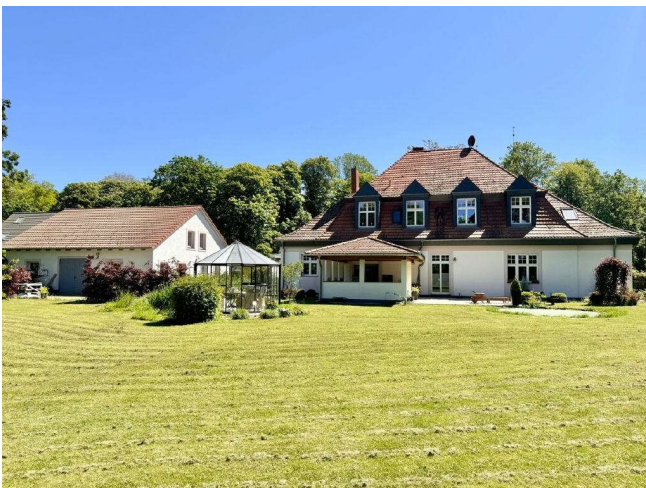
Grundstück + Haus + Garagenhaus