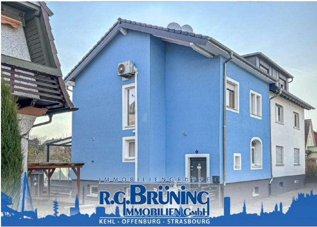
Doppelhaushälfte in Kehl-Stadt